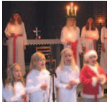
2009 års Luciatåg i Sigfridskyrkan.

Kyndelmässodagen 6 febr kl 18.00 Ljsgudstjänst. Sång av Angelicakören och Angelakören.