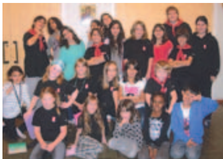
SKU:s medlemsläger 22-23 oktober 2010

Andakt, kaffe, försäljning, lotterier, korv o bröd, brödförsäljning. Sång och musik av kyrkokören. Medverkan av barngrupperna, diakonimedarbetarna, pysselgruppen, ungdomsgruppen, konfirmanderna. Behållningen går till ett handikapphem i Uruguay och genom Slättmissionen till ett barnhem i Rumänien.