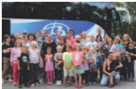
Nöjda och glada deltagare på resa till Borås djurpark.