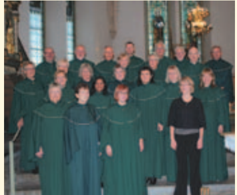
S:t Nicolai kyrkokör

Julens sånger och psalmer med kören Cantare